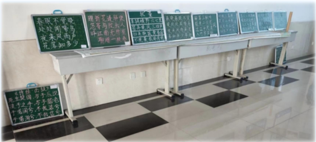
学生艺术科技作品展